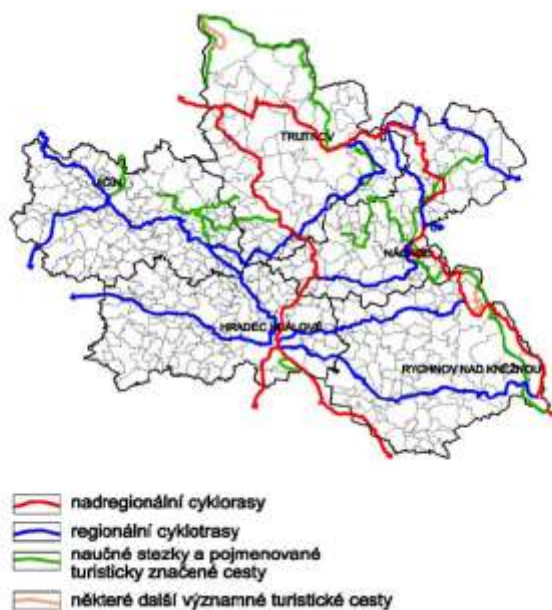
Mapa č. 2: Významné turistické trasy, cyklotrasy a cyklostezky Královéhradeckého kraje 3

Na území KJH je pouze jeden vodácky významný vodní tok a tím je řeka Úpa, zajímavá je zejména na začátku jara nebo po vydatných deštích na podzim. Řeka protéká obcemi Suchovršice, Úpice a Havlovice směrem do turisticky zajímavého Babiččina údolí v Ratibořicích. Centrum rozvoje Česká Skalice ve spolupráci s obcemi a svazky obcí na toku řeky Úpy před několika lety zpracovaly marketingový plán turistického rozvoje „Modrý pás Úpy“, který zmapoval možnosti odpočívadel, splavnosti řeky a dalšího turistického využití vodního toku řeky Úpy a okolí.