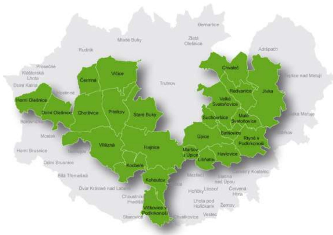
Mapa č. 1: MAS Království - Jestřebí hory

Království – Jestřebí hory se z hlediska územněsprávního členění nachází na území Královéhradeckého kraje. Z pohledu členění České republiky na turistické regiony a oblasti zasahuje KJH do turistického regionu Východní Čechy (v něm pak Kladské pomezí) a z části do regionu Krkonoše a Podzvičinsko.