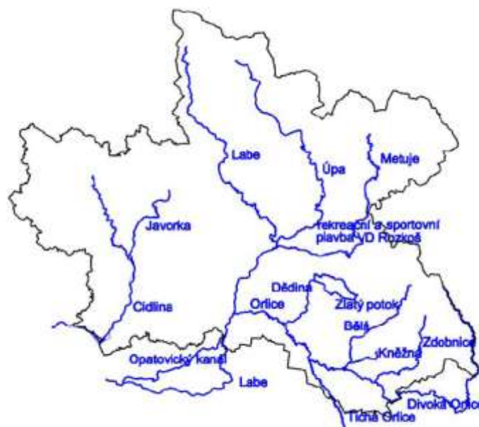
Mapa č. 3: Vodácky významné toky Královéhradeckého kraje 4

V současné době jsou hipposlužby (půjčování koní k vyjíždkám, výuka jízdy na koni) poskytovány ve Vítězném, Chotěvicích a Pilníkově.