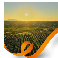
Oranžová stuha roku 2024