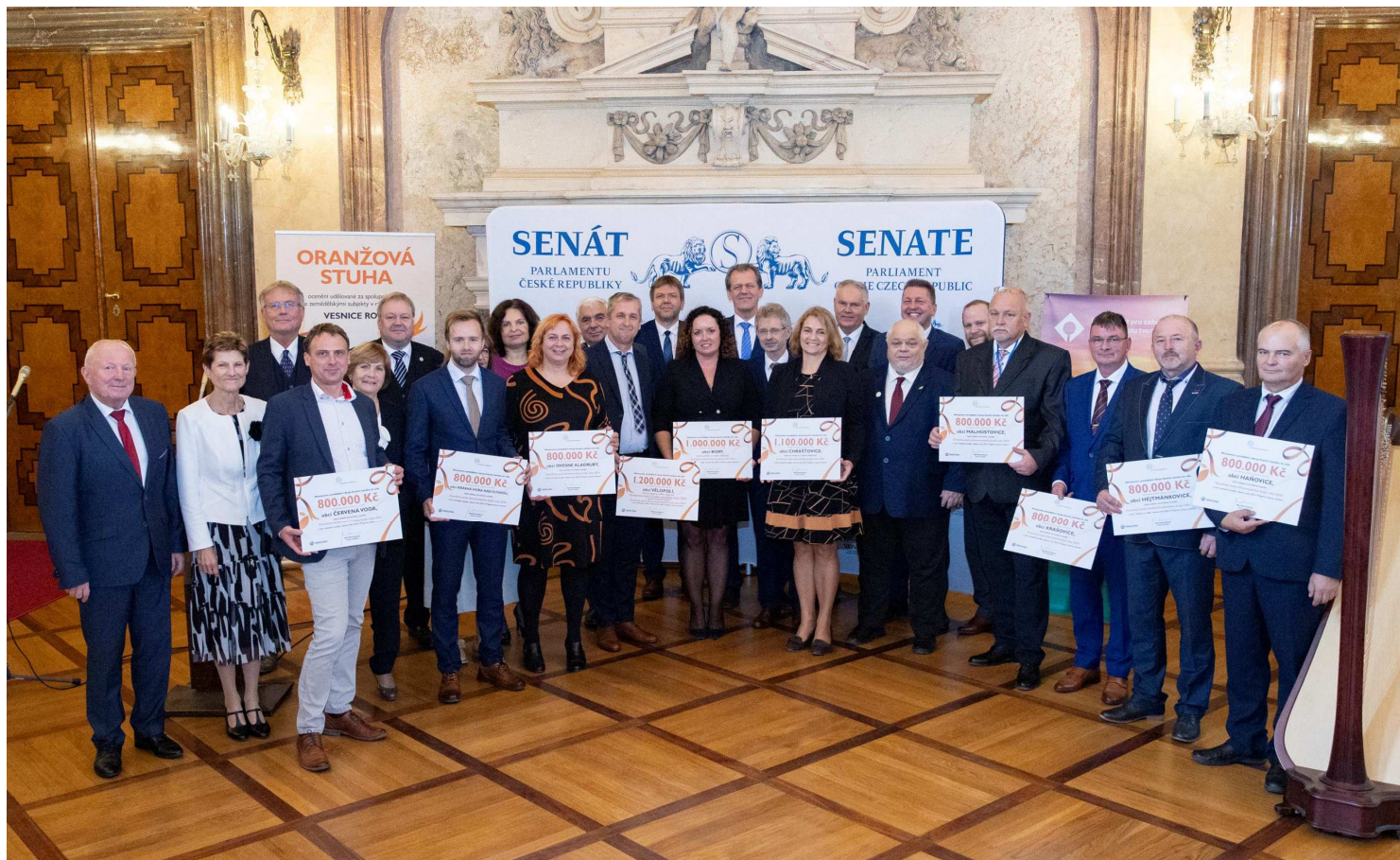
Slavnostní vyhlášení Oranžové stuhy ČR 2024 v Senátu PČR dne 22. 10. 2024